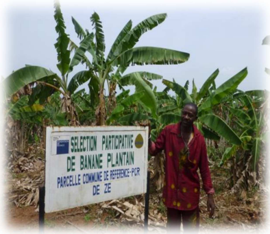
Un projet soutenu par le CFSI au Bénin