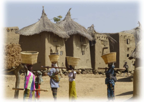
Grenier au Mali, pays Dogon